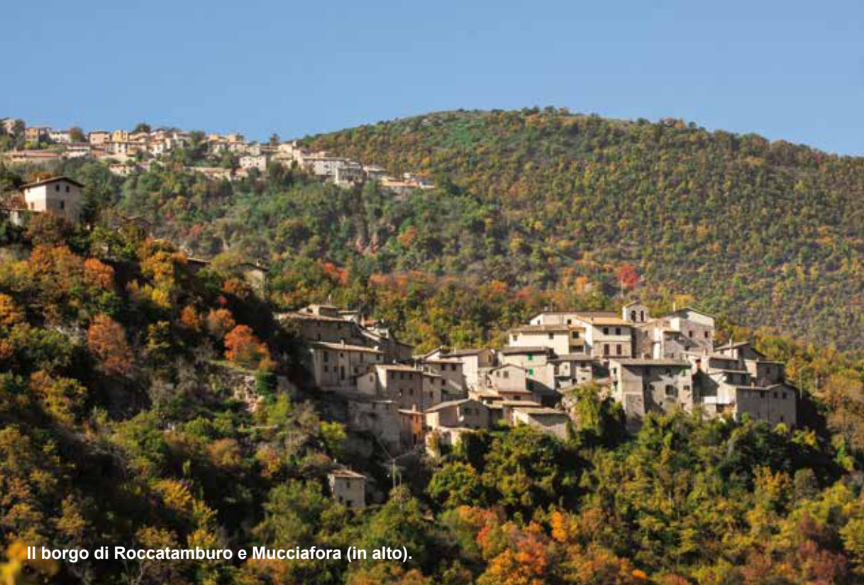
Il borgo di Roccatamburo e Mucciafiora (in alto).